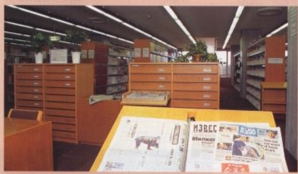
3F 雑誌閲覧室・新聞コーナー

外国で発行された雑誌が、新刊・バックナンバー合わせて、誌名順に配架されています。(所蔵種数3,219種 内継続受入約849種)